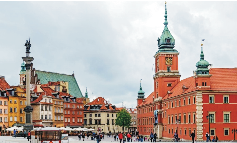
На здымку: Стары горад.