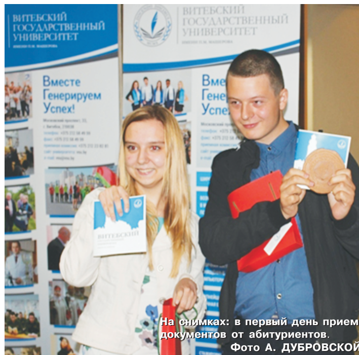
На снимках: в первый день приема документов от абитуриентов.

— Когда я посетила день открытых дверей в ВГУ имени П.М. Машерова, то поняла, что здесь очень хорошие преподаватели, общительные и доброжелательные студенты,