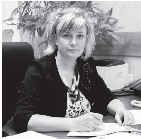
Фото и текст Алеся ДУБРОВСКОЙ.

С каждым годом все больше выпускников нашего университета поступает в магистратуру. Нередко бывает, что на вторую ступень образования приходят и те, кто окончил вуз несколько лет назад. Среди них – руководители и педагогические работники учреждений образования, специалисты органов управления образованием различного уровня, специалисты и руководители социальных учреждений и кадровых служб предприятий и др.