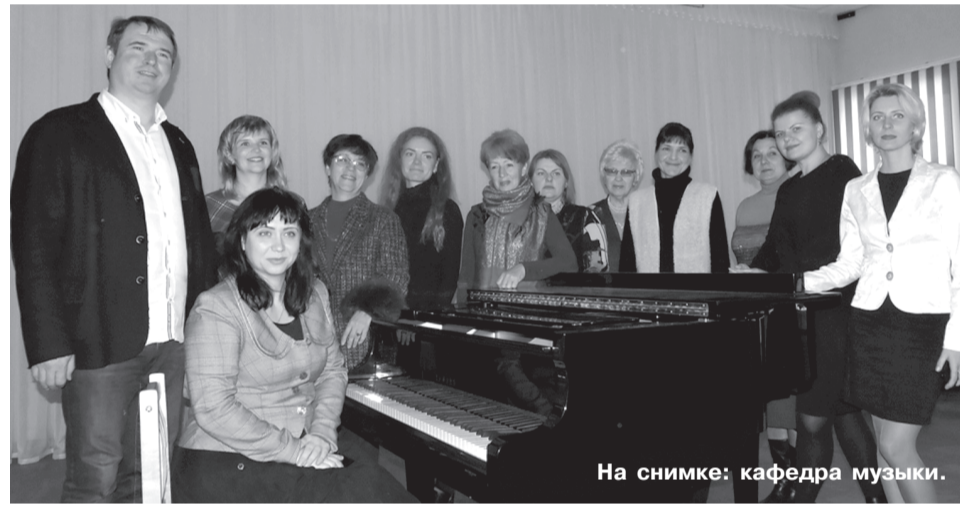
На снимке: кафедра музыки.

Кафедра коррекционной работы обеспечивает изучение 64 дисциплин и является выпускающей для следующих специальностей: «Олигофренопедагогика», «Олигофрено-