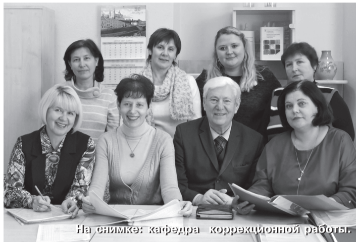
На снимке: кафедра коррекционной работы.

циальностям факультета: «Дошкольное образование» и «Начальное образование».