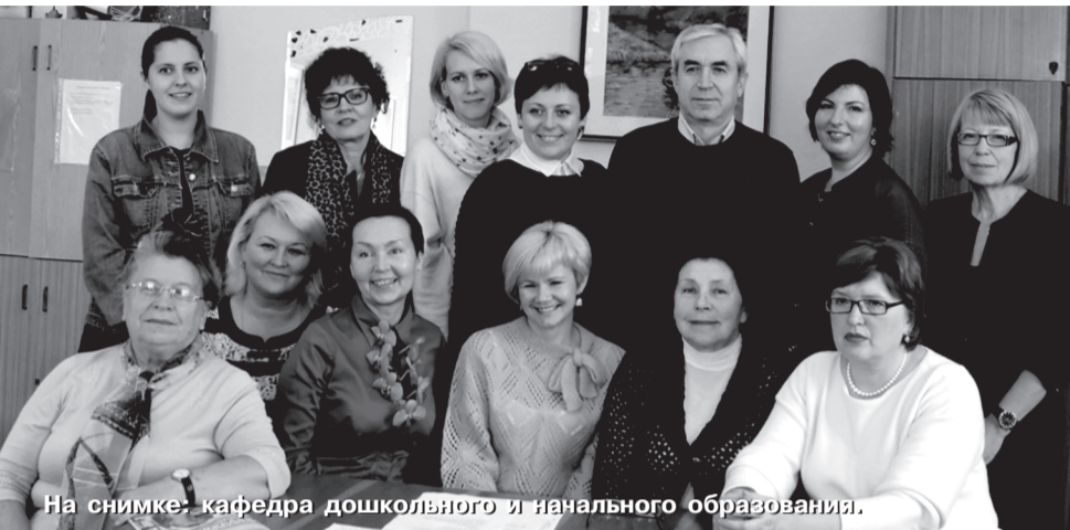
На снимке: кафедра дошкольного и начального образования.