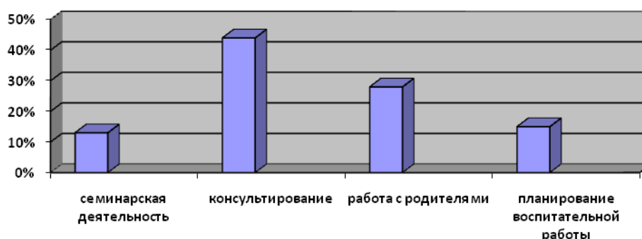
Рисунок 1 – Мнение педагогов о видах помощи, оказываемых педагогом социальным

Результаты и их обсуждения. Анализ ответов респондентов показал, что педагог социальный в учреждении образования больше всего выполняет прогностическую функцию (39%), затем диагностическую – 25%, воспитательную – 11%; организаторскую – 14%; коммуникативную – 5%; социально-терапевтическую – 3%, охранно-защитную – 6%. Педагог социальный оказывает и методическую помощь в области организации воспитательно-образовательного процесса в 90%, не регулярно – 10%. Ответы респондентов о виде помощи, которую оказывает педагог социальный, распределились следующим образом: социально-педагогическое консультирование – 44%, помощь в организации работы с родителями и (или) лицами, их замещающими – 28%, помощь в осуществлении планирования воспитательной работы – 15%, приглашение к участию в семинарах, консультациях – 13% (рисунок 1).