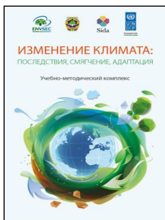
Рисунок 2 – Учебно-методический комплекс «Изменение климата: последствия, смягчение, адаптация»