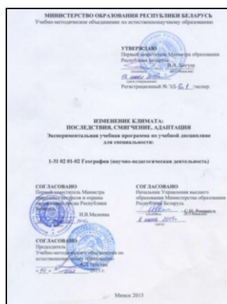
Рисунок 1 – Экспериментальная учебная программа по учебной дисциплине «Изменение климата: последствия, смягчение, адаптация»