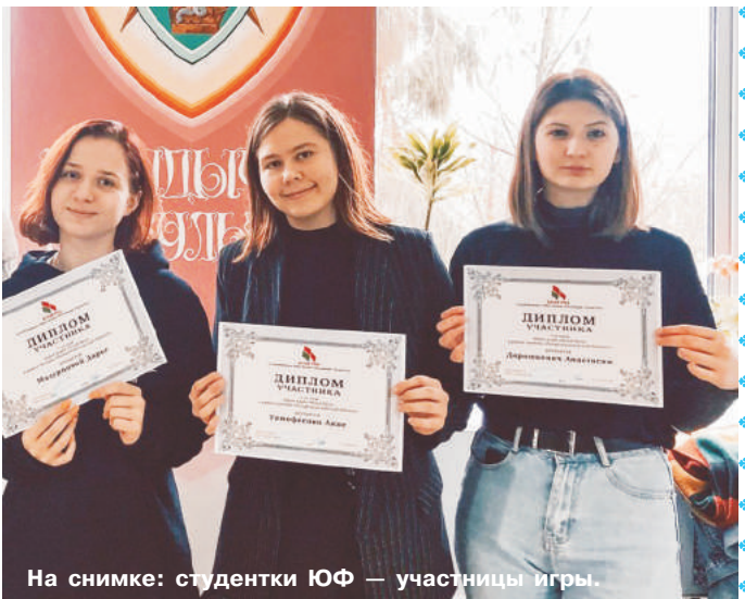
На снимке: студентки ЮФ – участницы игры.