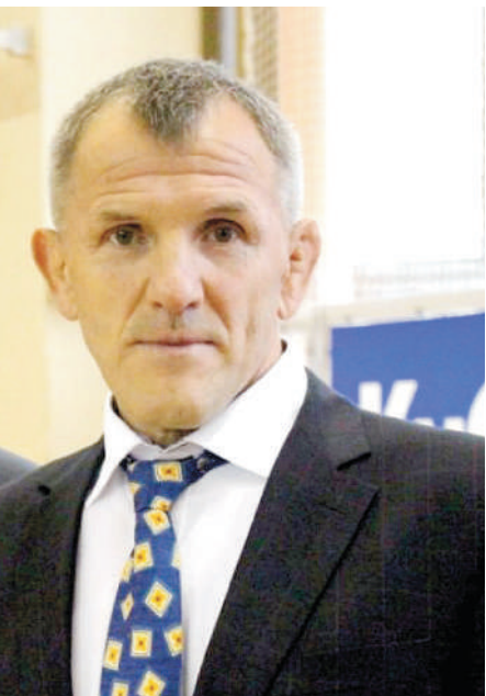
Игорь КАНЫГИН, заслуженный мастер спорта СССР, серебряный призер Олимпийских игр 1980 года, трижды чемпион мира и четырежды чемпион Европы