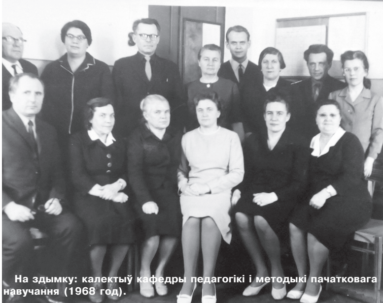
На здымку: калектыў кафедры педагогікі і метадыкі пачатковага навучання (1968 год).

Фота з сямейнага архіву (злева) і з музея ўніверсітэта (справа).