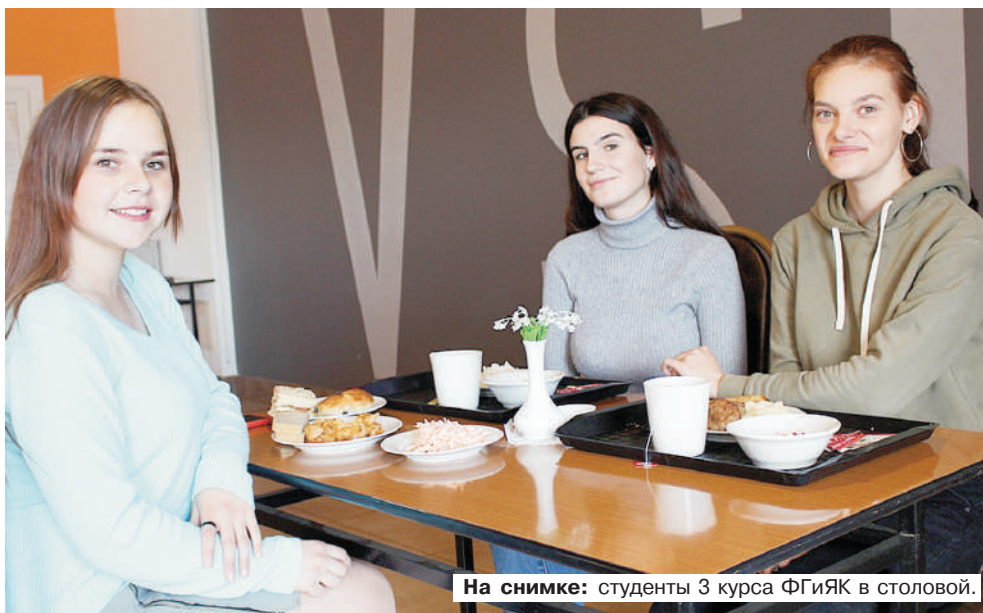
На снимке: студенты 3 курса ФГиЯК в столовой.

В столовой нашего университета приемлемые цены. Можно пообедать вкусно и недорого. Мои любимые блюда – draniki и суп с фрикадельками.