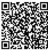
Фото- и видеорепортаж смотрите с помощью QR-кода.