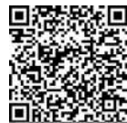
Фото- и видеорепортаж с Машеровского приема смотрите с помощью QR-кода.

Подготовила Виктория АЛЕКСАНДРОВА.