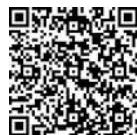
Фото- и видеорепортаж с церемонии награждения смотрите с помощью QR-кода.