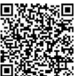
Фото- и видеорепортаж с церемонии вручения аттестатов смотрите с помощью QR-кода.