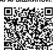
Фото- и видеорепортаж с турслета смотрите с помощью QR-кода.