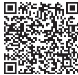
Фото- и видеорепортаж смотрите с помощью QR-кода.